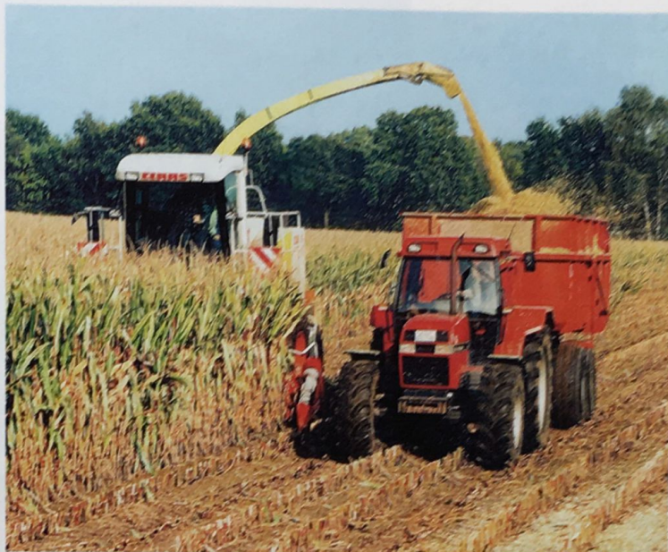
Auf den Pflichtteil gesetzte Erben haben einen reinen Geldanspruch. Sie können keinen Anteil am Hof verlangen.

Falls betriebswirtschaftlich mehr drin ist, sollte der Hofübergeber überlegen, den Pflichtteilsberechtigten entsprechend mehr zugestehen. So könnte er den pflichtteilsberechtigten Kindern vorab oder bei Hofübergabe bestimmte Vermögenswerte oder Geldbeträge übertragen, die nicht auf den Pflichtteil angerechnet werden. Auch Sonderfälle, wie Bauerwartungsland oder besondere Einkünfte, z. B. aus betriebszu-