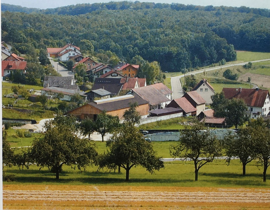
Hat ein Hofübergeber die weichenden Erben auf den Pflichtteil gesetzt, kann er ihnen zusätzlich bestimmte Vermögenswerte oder Geldbeträge übertragen.

und damit Gefahr laufen, nach dem Tod des zweiten Elternteils statt des vollen Erbteils auch hier nur den Pflichtteil zu erhalten.