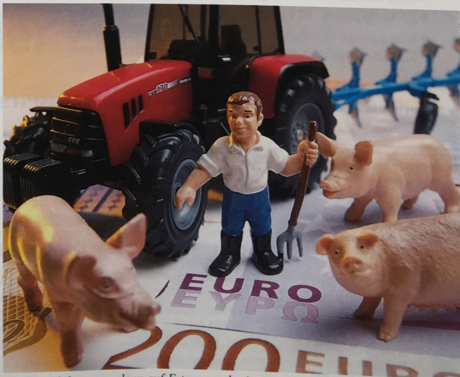
Ein Betrieb kann nur dann auf Ertragswertbasis vererbt werden, wenn es sich um ein Landgut im Sinne des BGB handelt.

Erste Voraussetzung ist, dass der landwirtschaftliche Betrieb ein Landgut im Sinne des Bürgerlichen Gesetzbuches ist. Das ist bei Betrieben der Landwirtschaft, Forstwirtschaft und des Erwerbsgartenbaus u. a., soweit diese eine Bodenbewirtschaftung bzw. bodenabhängige Tierhaltung betreiben, grundsätzlich der Fall. Nach einer grundlegenden Entscheidung des Bundesgerichtshofes aus dem Jahr 1964 muss es sich dabei um eine Besetzung handeln, „die eine zum selbstständigen Betrieb der Landwirtschaft einschließlich der Viehzucht oder der Forstwirtschaft geeignete und bestimmte Wirtschaftseinheit darstellt und mit den nötigen Wohn- und Wirtschaftsgebäuden versehen ist“. Diese