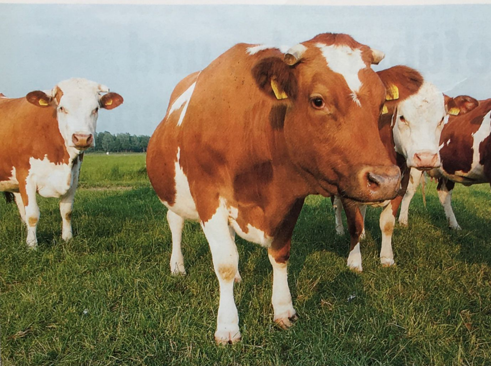
Ist der Hofnachfolger Alleinerbe, bekommen die Geschwister nur noch den Pflichtteil.

die nach dem allgemeinen Erbrecht gesetzliche Erben wären. Er kann auch andere als die gesetzlich vorgesehenen Erbanteile für seine Erben anordnen.