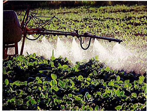
Wer verpachtet, darf vorschreiben, wie der Pächter die Pachtsache zu bewirtschaften hat – und in der Landwirtschaft beispielsweise Glyphosat verbieten.

Wer pachtet, verpflichtet sich laut BGB dazu, die Vertragsache ordnungsgemäß zu bewirtschaften . Der Begriff „ordnungsgemäß“ ist jedoch gesetzlich nicht festgeschrieben. Grundsätzlich bedeutet es, dass der Pächter das Restaurant gastronomisch oder den Bauernhof landwirtschaftlich bewirtschaften muss. „Was das im Einzelfall für den Pächter bedeutet, hängt aber von den Vorstellungen des Verpächters ab“, erklärt Deuringer. Denn dieser dürfe im Pachtvertrag detailliert vorschreiben, wie er sich die Bewirtschaftung des Betriebes wünscht. „Häufig geht es vielen Verpächtern dabei auch darum, den Ruf des Objektes zu schützen“, sagt der Pachtexperte. In der Landwirtschaft sei es zum Beispiel üblich, dass der Pächter einen ökologischen Betrieb auch nach ökologischen Vorschriften bewirtschaften müsse. „Der Verpächter darf ihm dann auch vorschreiben, dass er etwa auf Düngemittel oder Pflanzenschutzmittel wie Glyphosat verzichten muss.“ Für gastronomische Immobilien gibt es wieder andere Regeln: „Der Verpächter darf beispielsweise festlegen, ob Pächter eine Bar, ein Tanzlokal oder ein gehobenes Speiselokal betreiben dürfen.“ Die ordnungsgemäße Bewirtschaftung ist also eine individuelle Beurteilungssache und muss im Pachtvertrag festgelegt werden.