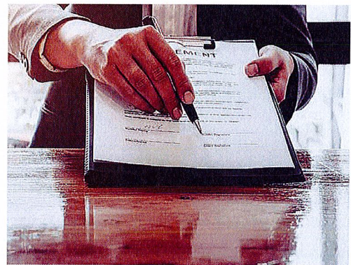
Verkauft der Verpächter die Immobilie, bleibt der Pachtvertrag bestehen und wird mit dem neuen Eigentümer fortgesetzt.

Häufig fragen sich Verpächter, ob ihr Pächter ein Vorkaufsrecht hat. Fachanwalt Deuringer gibt Entwarnung: „Solange im Pachtvertrag nichts Spezielles vereinbart ist, hat der Pächter kein Mitspracherecht.“ Ist im Pachtvertrag ein Vorkaufsrecht vereinbart, muss der Pachtvertrag jedoch insgesamt notariell beurkundet werden (§311b Absatz 1 BGB).