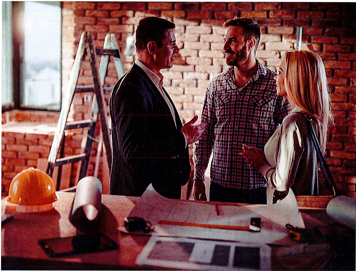
Planen Pächter Umbaumaßnahmen am Pachtobjekt, sollten Verpächter mit ihnen klären, was nach Ende des Pachtvertrages damit geschieht.

Endet das Pachtverhältnis, gibt es bei einem Pachtverhältnis einiges mehr zu klären als bei einem Mietverhältnis. Denn der Pächter muss nicht nur die Immobilie oder Ländereien zurückgeben, sondern auch das zugehörige Inventar, sofern mitverpachtet.