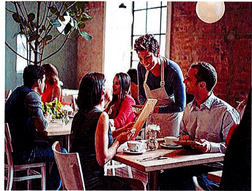
Werverpachtet, lässt sich die Nutzung der Immobilie mit einem in der Regel monatlichen Pachtzins bezahlen. In der Gastronomie ist es gängig, einen umsatzabhängigen Pachtzins zu verlangen.

Anpassungsrecht ein (§593 BGB). Voraussetzung ist jedoch, dass sich die Verhältnisse stark verändert haben, also beispielsweise der regionale Pachtzins gestiegen ist (Beschluss OLG Oldenburg vom 09. Juli 2009, Az.: 10W13/10).