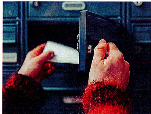
Möchte sich der Verpächter von seinem Pächter trennen, muss er schriftlich kündigen.

Pachtjahres möglich. Es gilt eine Kündigungsfrist von einem halben Jahr . Das Schreiben muss dem Pächter spätestens am dritten Werktag des Halbjahres, zu dem der Vertrag enden soll, vorliegen. Eine Sonderregelung gibt es außerdem bei der Landpacht : Dort gilt für unbefristete Pachtverträge ebenfalls eine Kündigungsfrist von zwei Jahren .