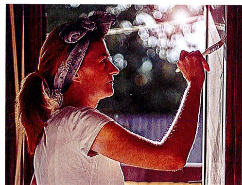
Ist im Pachtvertrag nichts anderes vereinbart, muss sich der Pächter um gewöhnliche Ausbesserungen wie das Streichen von Fensterrahmen kümmern.

Ausbesserungen aus – diese müsse der Pächter durchführen. Dazu zählen beispielsweise: